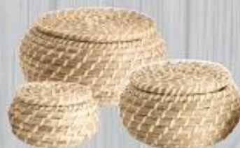
FRYKEN pojemniki z pokrywką 3 szt. 803.281.45