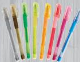
MÅLA długopis żelowy 8 szt. różne kolory 202.661.74