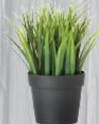
FEJKA sztuczna roślina 902.076.85