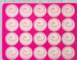
MÖNSTRAD mata do pieczenia 802.330.72