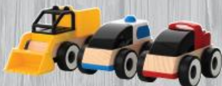
LILLABO ciężarówka, różne kolory 401.714.72