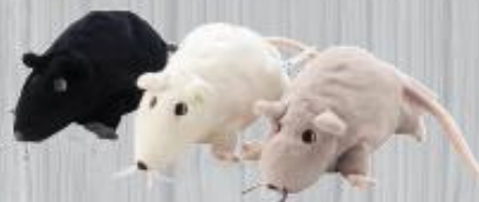
GOSIG RÅTTA pluszak, różne kolory 501.536.94