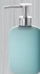
EKOLN dozownik do mydła 903.067.89