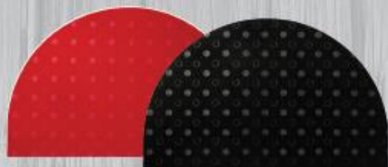
TVIS wycieraczka, czarny 202.393.07 czerwony 902.393.04