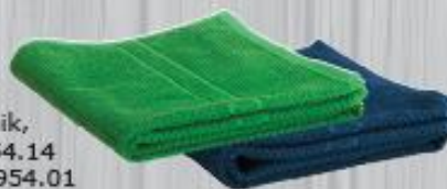
FRÄJEN ręcznik, zielony 702.954.14 niebieski 402.954.01