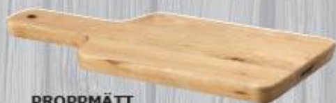
PROPPMÅTT deska do krojenia 302.334.18