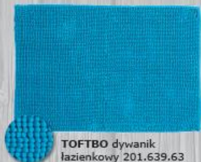
TOFTBO dywanik łazienkowy 201.639.63