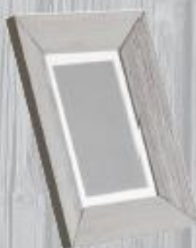
HVERDAL ramka 13x18 cm 502.647.34