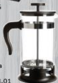
UPPHETTA zaparzacz 602.413.89