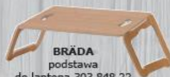
BRÅDA podstawa do laptopa 303.848.22