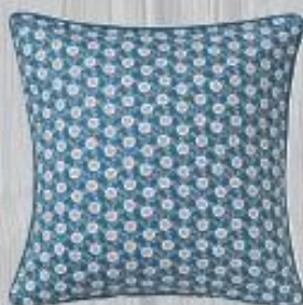
LOVKOJA poszewka 203.125.19