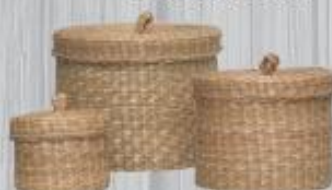
LJUSNAN pudełko z pokrywką, 3 szt 700.134.62