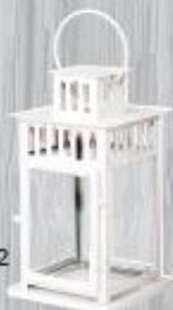
BORRBY lampion 302.701.42