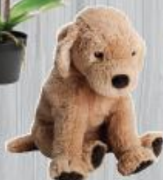
GOSIG GOLDEN pluszak 001.327.98