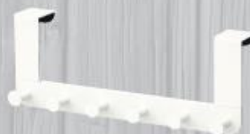
ENUDDEN wieszak na drzwi 602.516.65