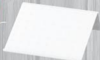
ISBERGET podstawka na tablet 203.025.96