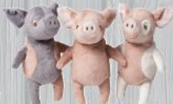
KELGRIS pluszak, świnka, różne wzory 102.980.00