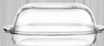
BUREN naczynie żaroodporne 002.145.91