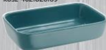
LYCKAD naczynie żaroodporne 203.189.60