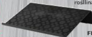
BRADA podstawa pod laptopa 601.501.76