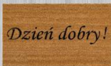
ÅRHUS wycieraczka 302.376.66