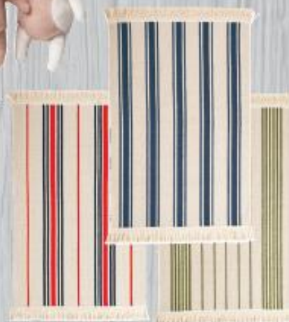
SIGNE dywan tkany na płasko, różne kolory 002.973.60