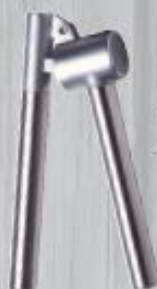
KONCIS wyciskacz do czosnku 000.891.63