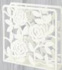
LIKSID uchwyt na serwetki 802.099.01