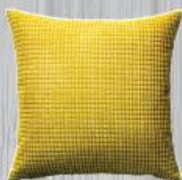
GULLKLOCKA poszewka 002.863.85