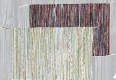
TANUM dywan tkany na płasko, różne kolory 302.126.75