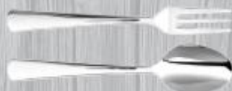
SEDLIG sztucce do serwowania 2 szt. 602.033.73