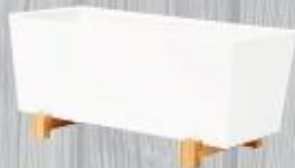
BITTERGURKA osłonka doniczki 802.857.87