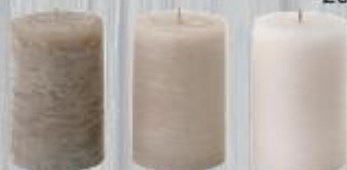
LUGGA świeca zapachowa 3 szt. 402.592.24