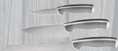
ÄNDLIG noże 3 szt. 702.576.24