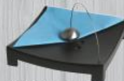
KNYCK uchwyt na serwetki 800.454.48