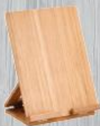
GRIMAR uchwyt na tablet 302.920.83