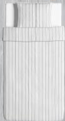
HOSTOGA pościel 003.141.33