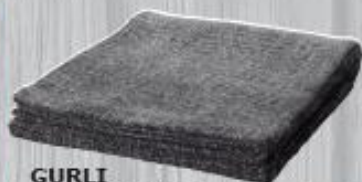
GURLI pled 202.049.06