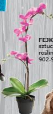
FEJKA sztuczna roślina 902.923.01