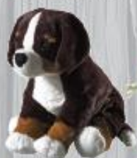
HOPPIG pluszak 902.604.42