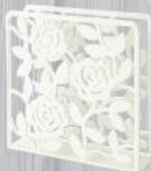
LIKSID uchwyt na serwetki 802.099.01