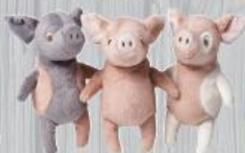
KELGRIS pluszak, świnka, różne wzory 102.980.00