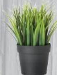
FEJKA sztuczna roślina 902.076.85