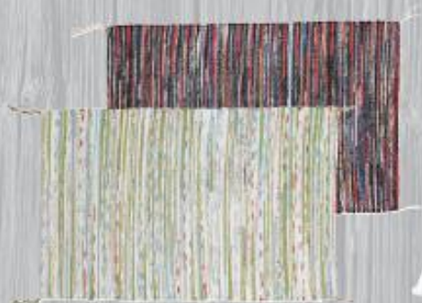
TANUM dywan tkany na płasko, różne kolory 302.126.75