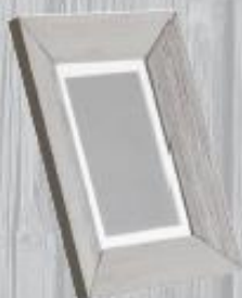
HAVERDAL ramka 13x18 cm 502.647.34