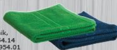
FRÄJEN ręcznik, zielony 702.954.14 niebieski 402.954.01