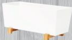
BITTERGURKA osłonka doniczki 802.857.87