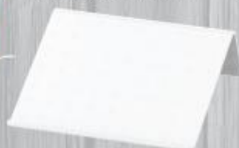
ISBERGET podstawka na tablet 203.025.96