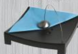
KNYCK uchwyt na serwetki 800.454.48