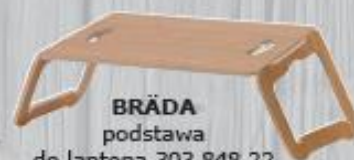
BRÅDA podstawa do laptopa 303.848.22