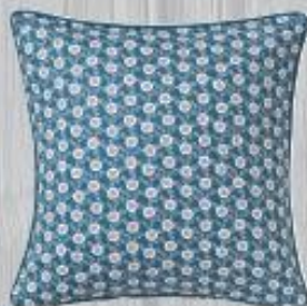
LOVKOJA poszewka 203.125.19