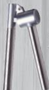
KONCIS wyciskacz do czosnku 000.891.63