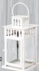
BORBÄ lampion 302.701.42