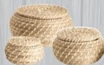
FRYKEN pojemniki z pokrywką 3 szt. 803.281.45