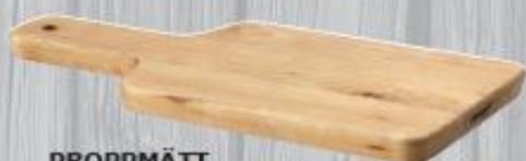
PROPPMÅTT deska do krojenia 302.334.18