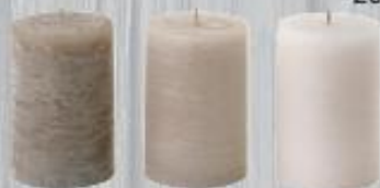
LUGGA świeca zapachowa 3 szt. 402.592.24