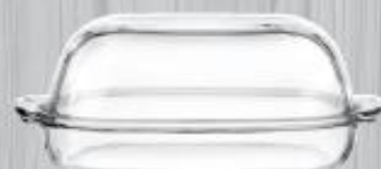
BUREN naczynie żaroodporne 002.145.91