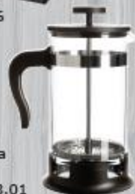
UPPHETTA zaparzacz 602.413.89