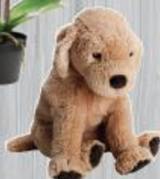
GOSIG GOLDEN pluszak 001.327.98