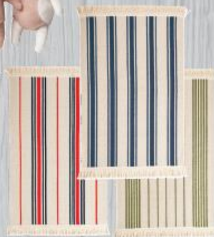
SIGNE dywan tkany na płasko, różne kolory 002.973.60