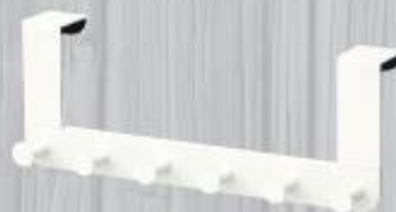
ENUDDEN wieszak na drzwi 602.516.65