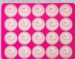
MÖNSTRAD mata do pieczenia 802.330.72