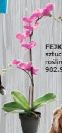
FEJKA sztuczna roślina 902.923.01