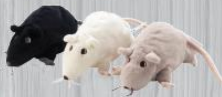
GOSIG RÅTTA pluszak, różne kolory 501.536.94