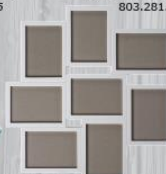
VÄXBO ramka na 8 zdjęć 402.566.21