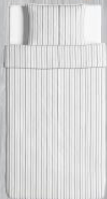
HOSTOGA pościel 003.141.33