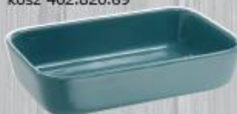
LYCKAD naczynie żaroodporne 203.189.60